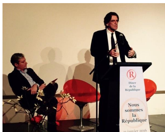
Intervention de Luc FERRY sur le thème : « Oui à la République ! Sans nostalgie, ni repli sur soi... »

L'intervention de Luc Ferry a montré à quel point notre société est en profonde mutation, tant sur le plan économique que sociétal. Le défi politique majeur de demain est de prévoir et d'anticiper ces changements et de construire un système capable de s'adapter pour ne pas laisser toute une partie de la population sur le bas-côté du progrès technologique et scientifique.