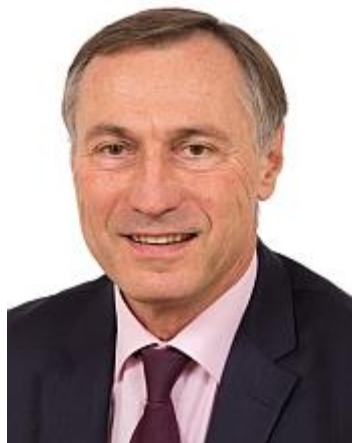
Jean-Marie BOCKEL Sénateur du Haut-Rhin