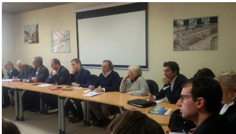
Une trentaine de personnes ont participé à la table-ronde

La ville de Marseille, et notamment certains de ses quartiers parmi les plus défavorisés de France, est révélatrice de l'ambition de rendre toujours plus accessible et concrète la République et ses valeurs auprès des populations les plus en difficultés.