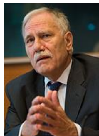
Dominique RIQUET Député européen

Pour retrouver l'intégralité de la question de Dominique RIQUET et la réponse du Ministre, cliquez : ici