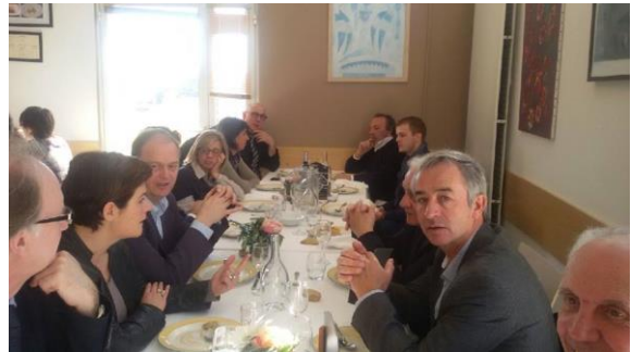
Déjeuner au restaurant pédagogique de l'École de la deuxième chance

La Rencontre, organisée sur toute la journée, s'est déroulée en trois temps : une visite des quartiers de rénovation urbaine dans la ville de Marseille ; un déjeuner militant dans le restaurant pédagogique de l'école de la deuxième chance et une après-midi consacrée à une table-ronde sur la thématique de la rénovation urbaine.